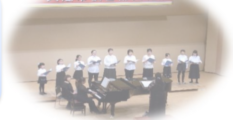
久慈市民芸術文化祭

Q すべての練習に参加できないかもしれない… A 参加できない日があっても大丈夫です。 練習した分だけ上達します。4回より多く参加することを目標として頑張りましょう！