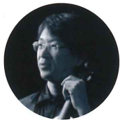
辻井 淳 ヴァイオリン

東京藝大卒業後、DAADによりシュトゥットガルト音楽大学へ。日本音楽コンクール第2位。1984～93年、京都市交響楽団コンサートマスター。CDは25枚以上。神戸女学院大学、愛知藝大で後進の指導にあたっている。アンサンブル ベガ、カモネット、マイハート弦楽四重奏団、京都バッハズリステンのメンバー。